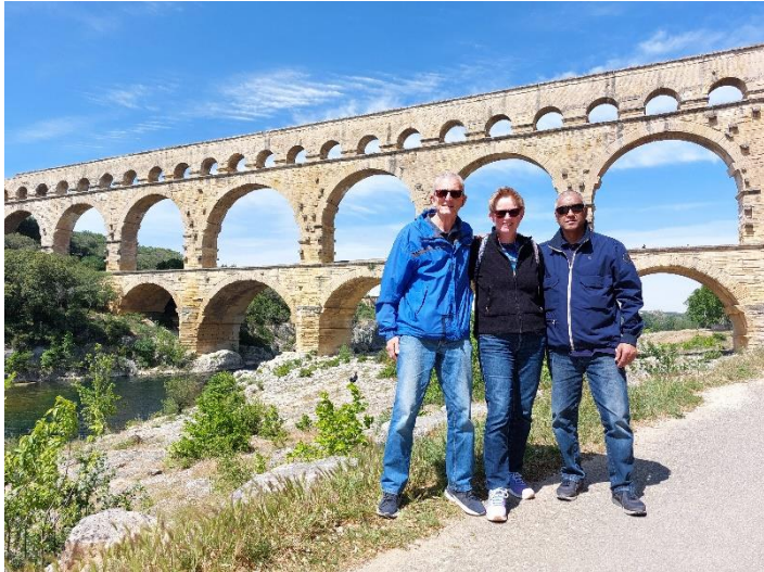
bij Pont du Gard

Om 7.00 uur stonden we op na een goede nachtrust. Hierna gewassen en aangekleed. Tegen 08.00 uur gingen we lekker ontbijten in de ontbijtzaal. Er was ontbijtbuffet. Voldoende gegeten. Het was reeds 09.15 uur, als we weggingen van de Motel. Eerst gingen we in centrum Chalon sur Saone vol tanken ( veel goedkoper dan op de snelweg ) Via Macon, Villafranche, Lyon ( erg druk, af en toe files ) , Valence en na Orange sloegen we af richting Remoulins, om naar de beroemde Romeinse brug, Pont du Gard, te kijken. Daaronder stroomt rivier Garonne. Prachtig om te zien.