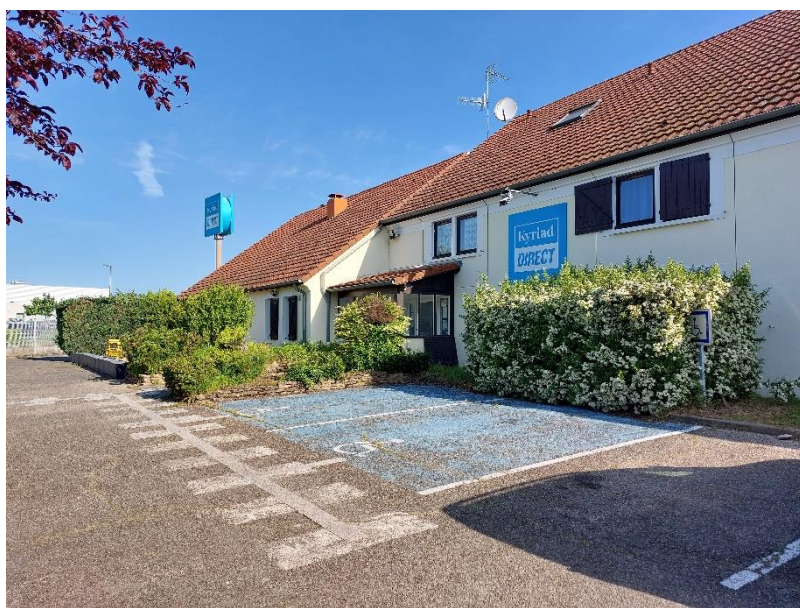
motel in Chalon sur Saone