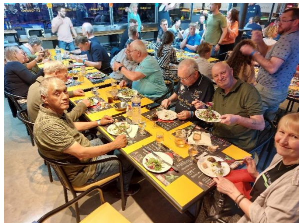
Nederlanders en daarachter Zwitsers