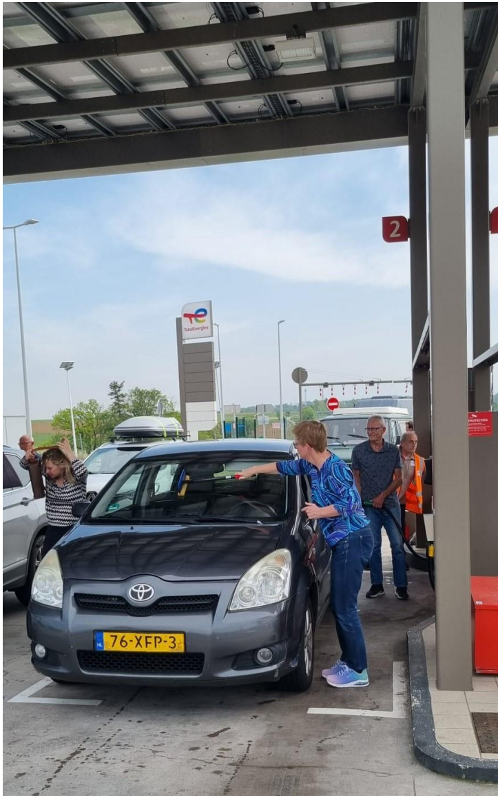
tanken en wassen auto vlakbij Dyon

We stonden om 7 uur op. Beter geslapen. Gewassen en aangekleed. Tegen half 8 gingen we ontbijten. Het was reeds na 8 uur, als we de tassen gingen inpakken. We namen afscheid van BC. Rotterdam en een aantal andere personen zoals Oekraïne. Om 08.30 uur waren we weg. De eerste 100 kms was het slecht weer, daarna steeds en steeds beter weer. Na drukke Lyon gingen we pauzeren en wat eten. Voor stad Dyon auto half bijgetankt en wat gegeten.