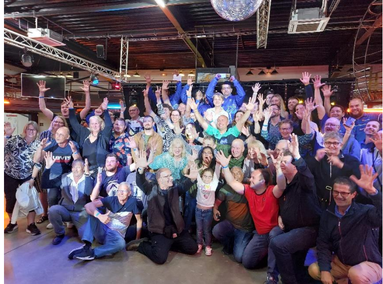
alle bowlers samen

Pas om 21 uur konden we met z'n allen dineren. Eerst salade met stukjes eenden vlees, daarna rijst met stoofvlees en wat groenten en tenslotte appeltaartje met slagroom. Hierbij dronken we rode wijn of rosé. Het was best lekker.