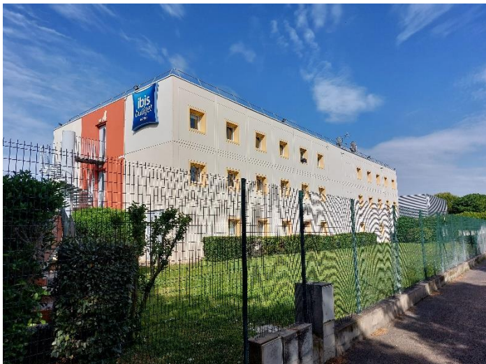
hotel Ibis Budget, Caissargues