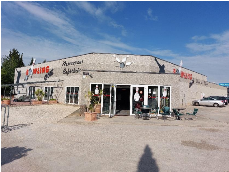
hal Bowling One, Caissargues

Hierna waren we te voet naar hal Bowling One, ongeveer 10 minuten verder gelegen. Daar aangekomen zagen we een aantal doven bowlingtraining doen, zoals teams uit VAE en Oekraïne. Uiteraard gingen we gezellig wapperen, met een drankje erbij.